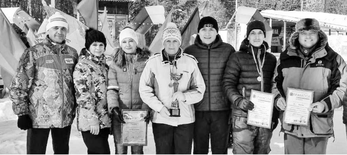
Думиничане - бронзовые призёры Спартакиады среди руководителей и сотрудников администраций муниципальных образований и городских округов Калужской области по лыжным гонкам.

В прошедшие выходные думиничские спортсмены завоевали целый букет весомых наград.